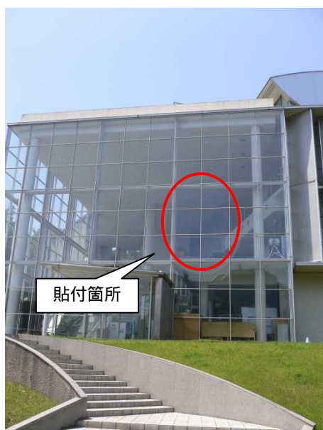
館 窓フィルム貼付場所

8月9日に 館2階の窓の一部に遮熱フィルムの貼付を行い、効果把握調査を開始しました。