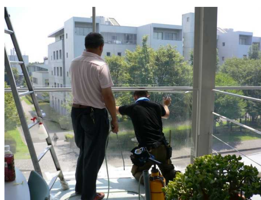
窓フィルム貼付施工状況